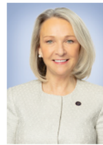
Sonia Bélanger Ministre responsable des Aînés et ministre déléguée à la Santé